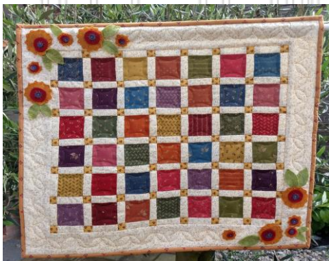
De Vrolijke Vierkantjes

Patchen op de naaimachine : je maakt een leuke quilt: De workshop (datum volgt nog) duurt van 10.00 u tot 15.00 u en je hebt daarbij je eigen naaimachine nodig. Prijs van de workshop is € 62,50 inclusief stoffenpakket voor de top, koffie/thee en een gezellige lunch.